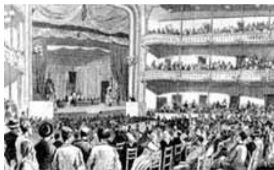
Aspecte del 1er Congrés Obrer d'abast estatal Barcelona, juny de 1870

Sin embargo, en 1868 los hombres de la Asociación Internacional de los Trabajadores , la primera gran organización obrera internacional, se trasladaron a España, con la finalidad de propagar sus ideas y fundar los primeros núcleos socialistas. En 1872 se producen dos acontecimientos importantes: Sagasta la declaró ilegal y por tanto dio lugar a su clandestinidad, y segundo, se produjo una doble línea de desarrollo teórico y organizativo: la anarquista, liderada a nivel internacional por Mijaíl Bakunin y la socialista por Carlos Marx 1 .